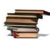
アフターサポート