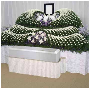
生花装飾 チランジア