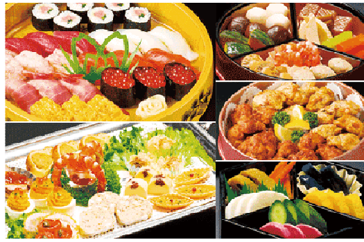
通夜料理 並セット 185 人前