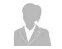
葬儀係員 1 名

※1 使用式場…臨海斎場の使用した場合を想定しております。組織区外の方は別途費用が掛る場合があります。