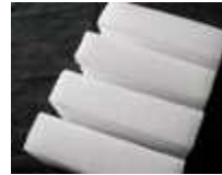
ドライアイス 3 回