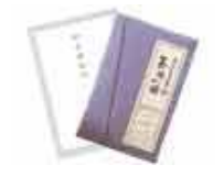
返礼品 235 個