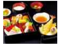
葬儀料理 30 名