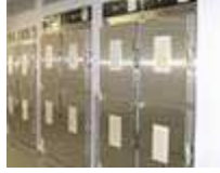
霊安室 5 泊