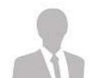
葬儀係員 6 名